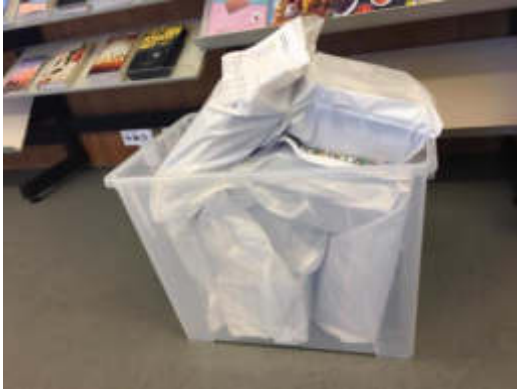
Abholbereite Medien während dem Lockdown...