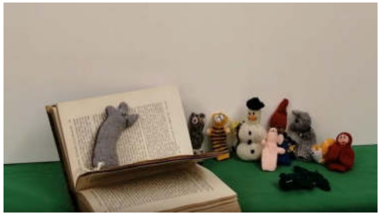
virtuelle Lesemaus (Youtube)